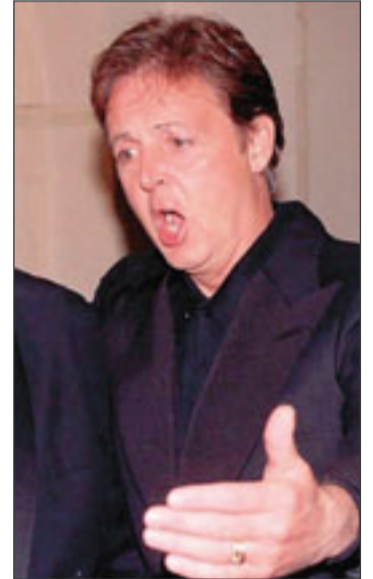
NOMINERT: Paul McCartney.