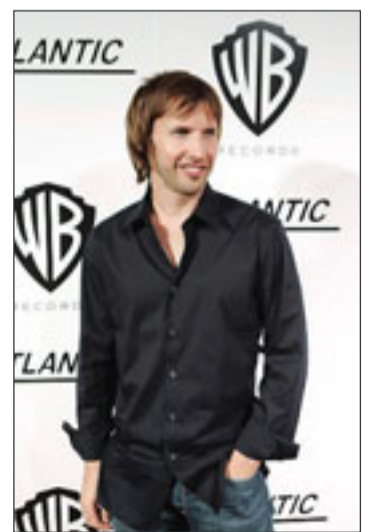
NOMINERT: James Blunt.