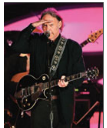
NOMINERT: Neil Young.