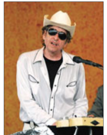
NOMINERT: Bob Dylan.