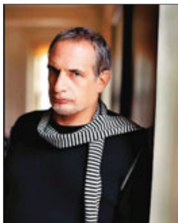
STJERNE 2: Donald Fagen. PROMOFOTO